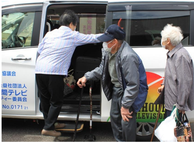
▲段差を少なくするステップが備えついており、乗り降りも快適です♪

▼車内には、乗降時や走行中につかめる手すりも多く、広くて乗り心地も良さそうですね！