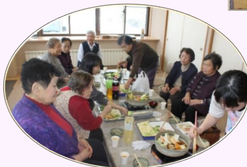
毎年恒例の新年会♪