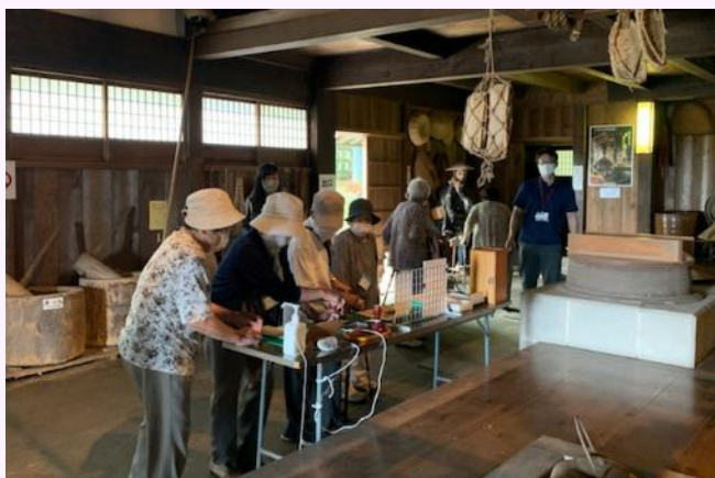
旧余市運上家を見学

真狩村身体障害者福祉協会では、昨今のコロナ禍により、事業活動の縮小など自粛する動きが続いておりましたが、この度、会員の皆さんと協議して、研修旅行を計画し、7月28日(木)に感染予防対策を講じて、日帰りの研修旅行を実施しました。