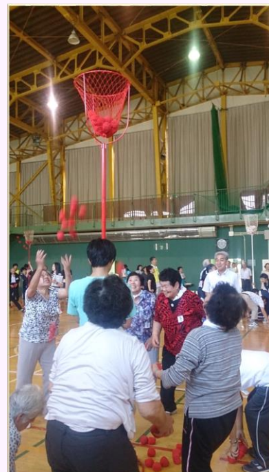
白熱のスポーツ大会！ (平成30年)

入会のお申込み又はご相談は真狩村社会福祉協議会までお気軽にお問い合わせください。