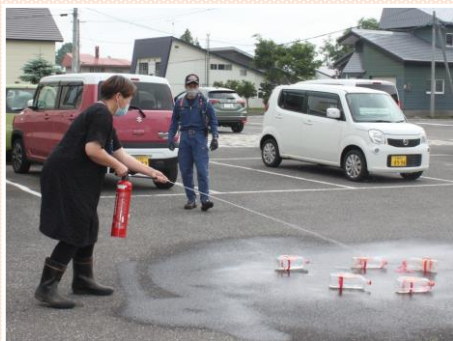
水消火器を使用しての模擬訓練

6月30日（木）保健福祉センターで避難訓練を実施し、野の花診療所、社会福祉協議会、学童保育ら関係者33名が参加しました。館内調理室からの火災を想定し、初期消火から避難指示、誘導を図るなど緊迫した空気の中で執り行いました。最後には職員に向けての消火器訓練を行い、消火器の正しい使い方や避難指示の動きなど羊蹄山ろく消防組合真狩支所の隊員の方々より総評いただき、日頃からの防犯意識の大切さを改めて感じました。