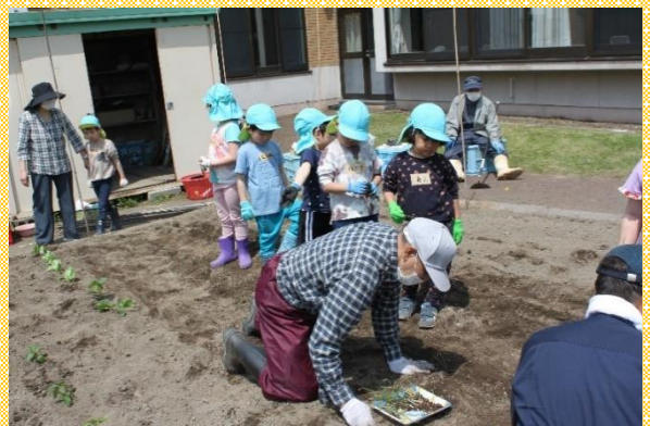
保育所の園児達と種まきの様子

畑の一角には、保育所の野菜も植えられ、園児達と一緒に草取りや収穫も行っています。