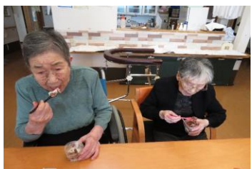
7月17日幸町ユニット