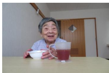
7月16日浜町ユニット

しあわせ荘各ユニットで「お誕生会」が行われました。皆さんおめでとうございます。元気で長生きして下さい。