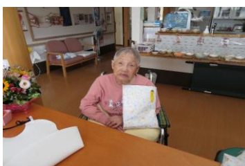
7月27日栄町ユニット