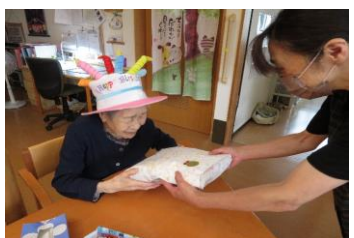
7月17日幸町ユニット