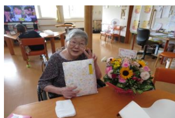
7月27日栄町ユニット