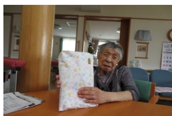
7月21日寿町ユニット