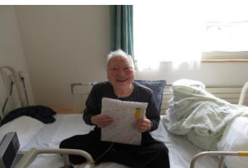
7月27日栄町ユニット