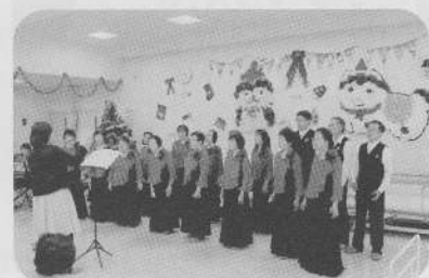
《はぼろコールスマイル》