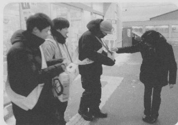
羽幌中学校生徒会様の街頭募金