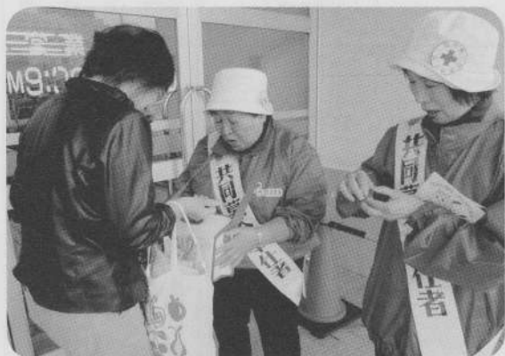
羽幌町日赤奉仕団様の街頭募金