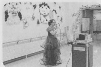
《歌好き姉妹と仲間たち》