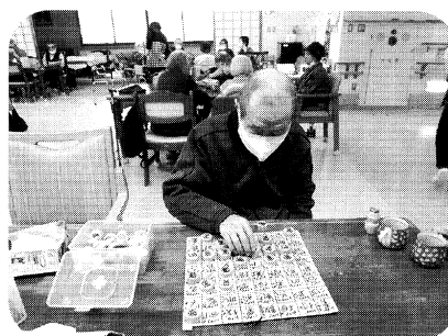
文字合わせパズルゲーム