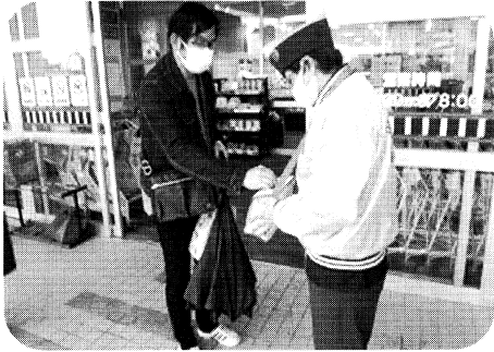
羽幌ライオンズクラブ様の街頭募金