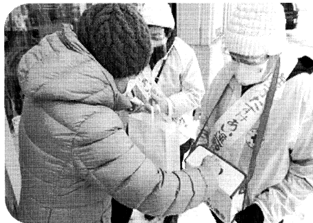
羽幌町赤十字奉仕団様の街頭募金