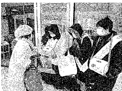
羽幌町赤十字奉仕団様の街頭募金