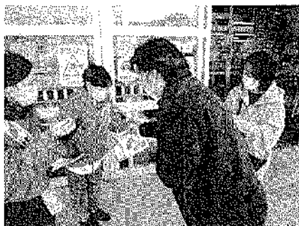
悠・悠クラブ様の街頭募金