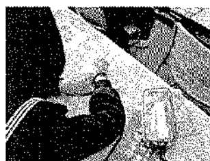
お便り運動事業：総シター (北海道羽幌高等学校)