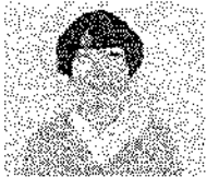
本部事務局 地域福祉係 福祉活動専門員

新年あけましておめでとうございます。 昨年の11月からしあわせ荘で勤務しております。 コロナウイルスの感染症の蔓延から3年が過ぎ、いまだと収束の兆しはなく、「いつ日常に戻るのか」と思いながらの日々です。行事や活動の中止、人との交流も失われ、ご家族の自由なご面会、行事への参加が出来なくなっております。 しあわせ荘は終の棲家として過ごすための住まいの一つであり、地域にとってなくてはならない大切な場所です。入居者の皆さまが毎日安心して穏やかに過ごしていただく事が私たちの役割であり、変えられる施設であり続けるために職員の一人として取り組んで参りますので宜しくお願い致します。