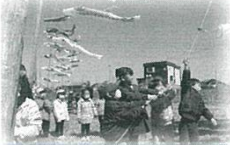
鯉のぼり掲揚事業