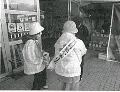
羽幌町赤十字奉仕団の皆様による街頭募金