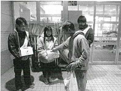
北海道羽幌高等学校の皆様による街頭募金