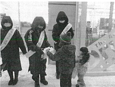
羽幌町立羽幌中学校の皆様による街頭募金