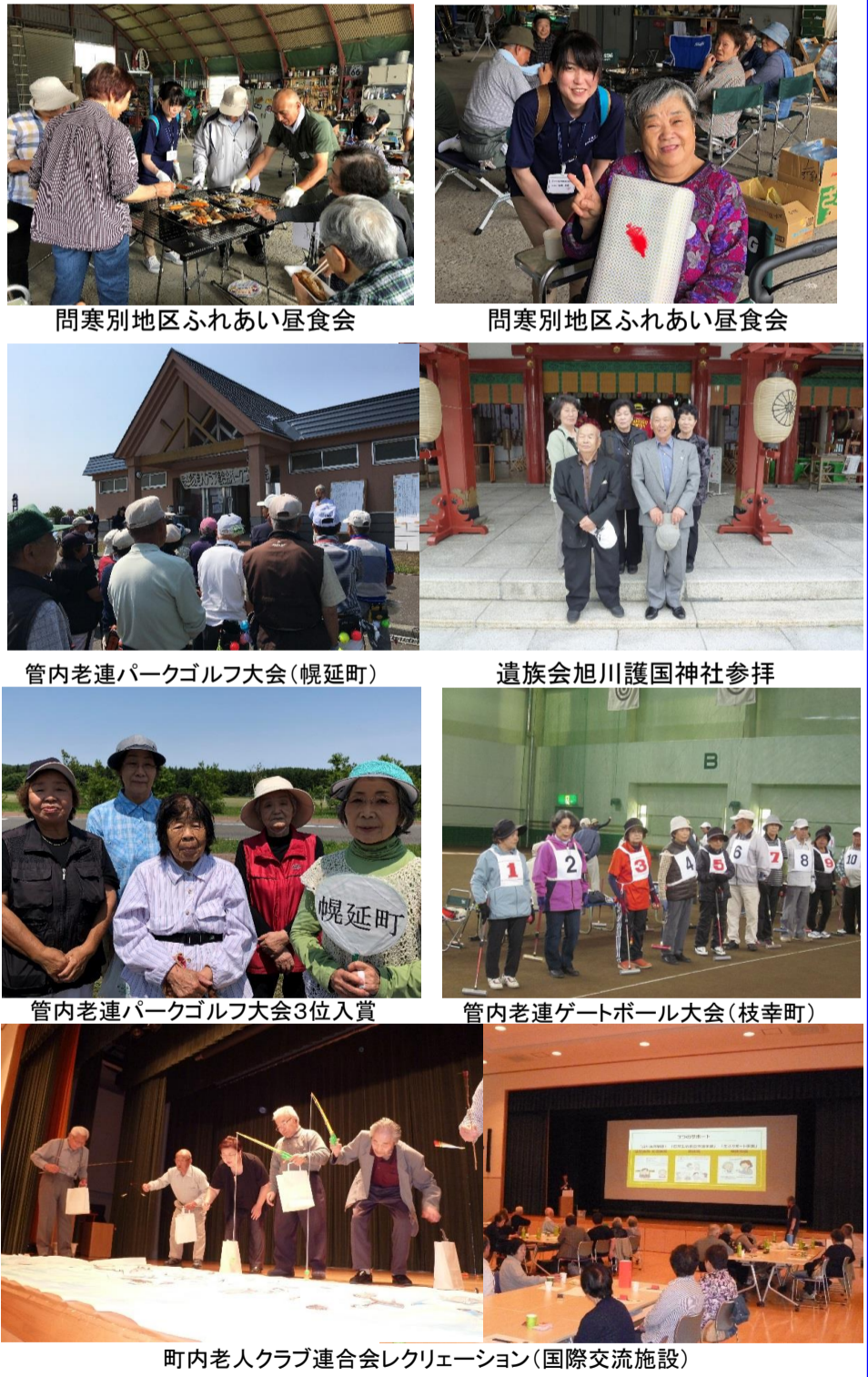
問寒別地区ふれあい昼食会