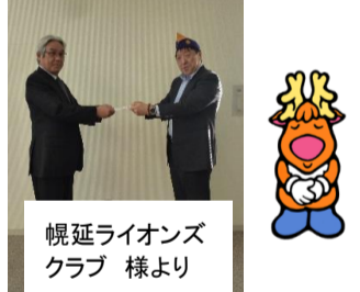
幌延ライオンズクラブ 様より

{寄贈品} 今年も北海道コカ・コーラ様から本会宛飲料水の寄贈がありましたので、北星園とごくら荘へ提供しました。