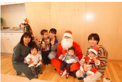
クリスマス会(チャチャ)