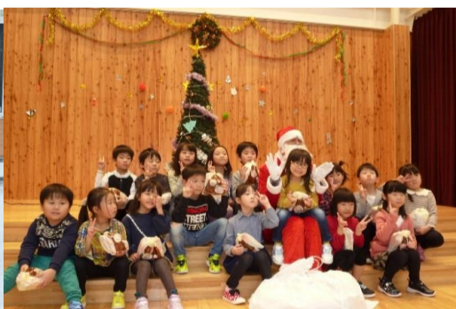
クリスマス会(こども園)