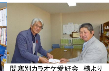
問寒別カラオケ愛好会 様より