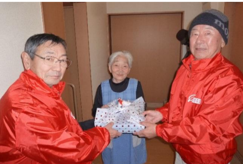
↑ おせち料理配付事業 ↓