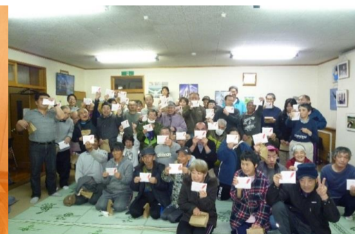
北星園グループホーム夕食会