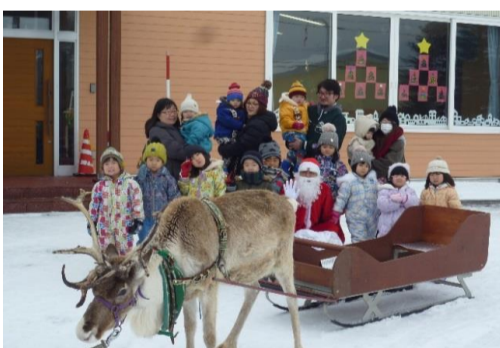
クリスマス会(問寒別保育所)