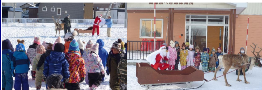
先生が代表でプレゼントもらったよ