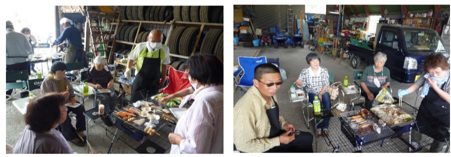
問寒別地区ふれあい昼食会