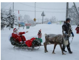
こども園 クリスマス会