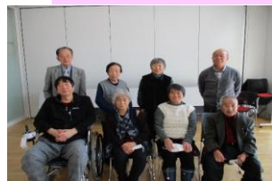
身体障がい者協会 集合写真♪

1月20日 身体障がい者協会の新年会を行いました。コロナもまだまだ流行中と思うように集まることができませんが、皆さん楽しそうに過ごされていました。3月には例会を行う予定です。