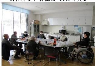
身体障がい者協会 談笑中♪