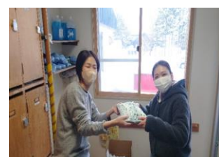
↑ グループホーム料理配付事業