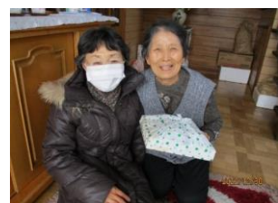
↑ おせち料理配付事業