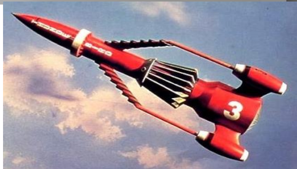
鶺本町のポール(上)サンダーバード3号(下)何となく似てますよね…?