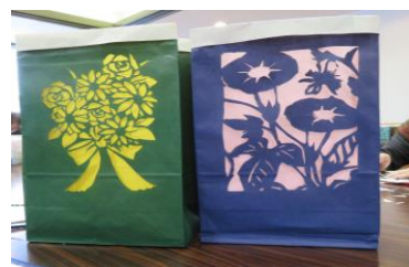
完成した紙ランタン

実際、会話も少ないため新型コロナウイルス感染のリスクが少なく、細かく紙を切る作業があるので集中・・・いや、「 全集中 」で行える。かつ、手の運動にもなるため、頭にも体にも良い作業であるかと思えます。