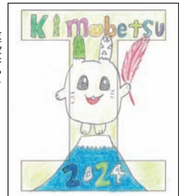
▶最優秀賞 今年度ピンバッチデザイン

最優秀賞のデザインは令和6年度喜茂別町赤い羽根ピンバッチとなります。ピンバッチができましたら改めてご報告いたします。ご協力いただいた皆様ありがとうございました。