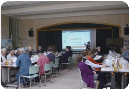
4月27日 喜茂別町老人クラブ連合会総会が開催されました