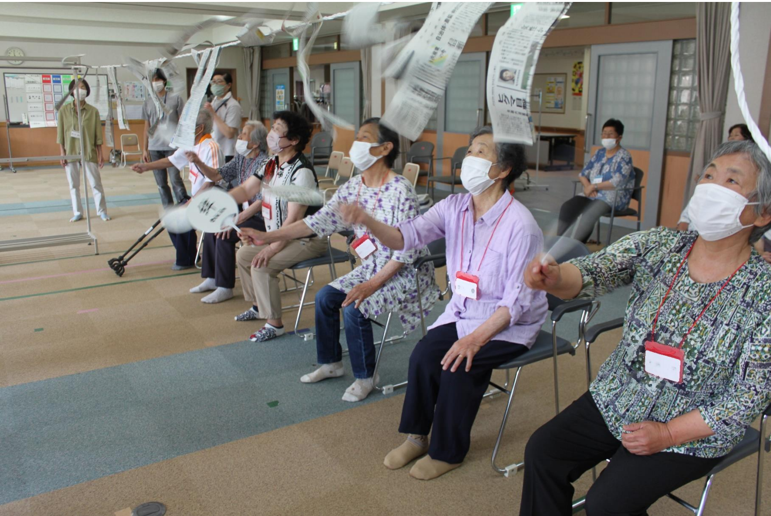
チーム戦の“新聞パタパタゲーム” 紐にぶら下げた新聞紙をうちわで仰いで全て落とし、そのタイムを競います！

7月18日(木)に保健福祉センターで恒例の「シルバーフェスティバル」を開催しました。今年も51名と多くのみなさんにご参加いただき、ゲームやビンゴなどで楽しく交流を深めました。