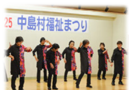
(ジャディス愛好会)