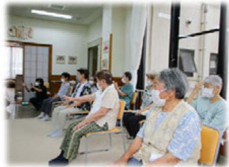
(デイサービス利用者)