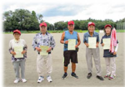
(村老人クラブ連合会長杯グラウンドゴルフ大会)