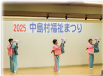
(中島スポーツ民踊きらり)