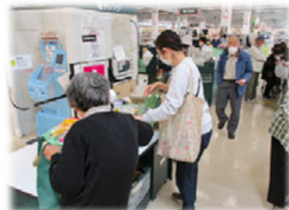
(買い物ツアー事業)