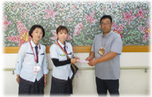
(郡山ヤクルト販売㈱より寄附)