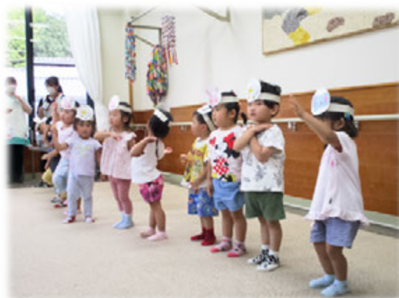
（中島保育所の子供たち）

デイサービスの利用者は、子供たちから手作りのお花のプレゼントをいただき、かわいい子供たちの歌あそびに笑顔で手拍子をしながら楽しい時間を過ごしました。