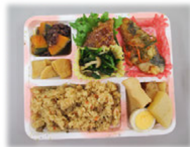
(配食サービス事業)