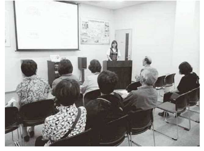
民生委員協議会研修事業 (道新総合印刷 旭川工場見学)