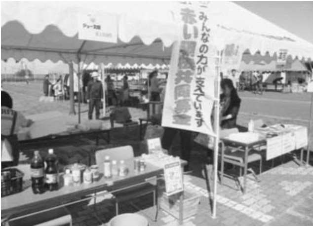
鬼鹿更生園「ふれあい広場」 (共同募金活動)