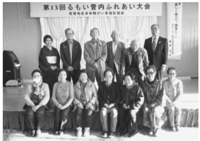
第13回のもい管内ふれあい大会