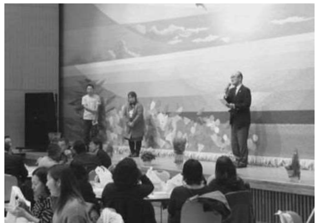
美味しい地物に感謝祭での益金寄附