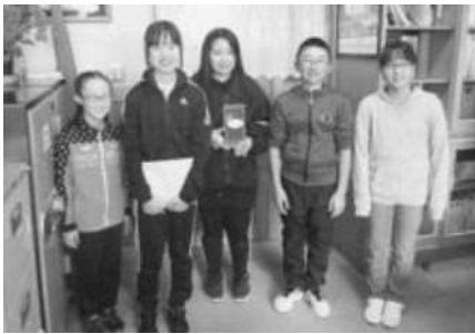
小平小学校 校内募金