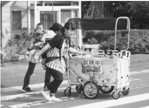
幼児センター避難訓練 (津波)