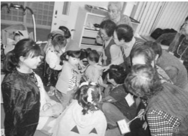
くるんぱ「ハロウィン」