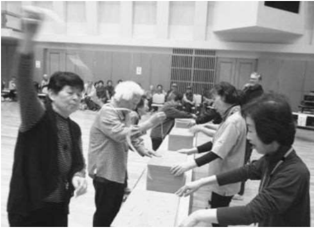
小平町高齢者健康推進事業 「イキイキスポーツ&芸能発表」