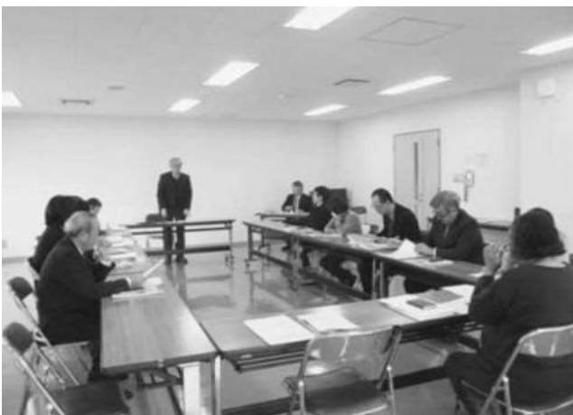
民生委員協議会 臨時総会