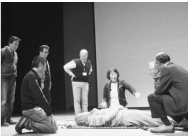
留萌地区ボラネット・スキルアップ事業