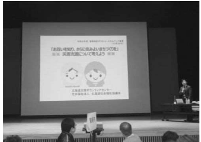
留萌地区ボラネット・スキルアップ事業