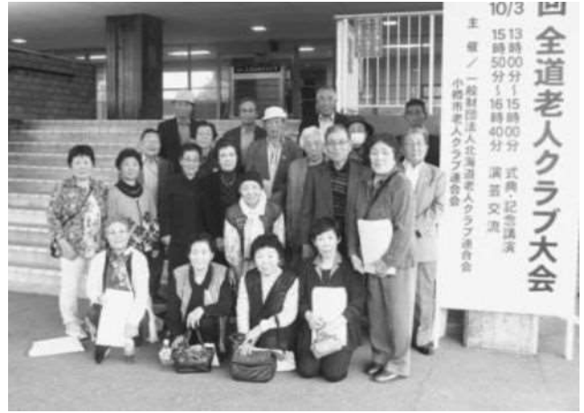
第56回全道老人クラブ大会 (小樽市)