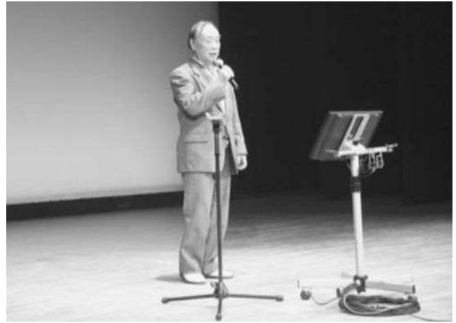
小平町高齢者健康推進事業 「イキイキスポーツ&芸能発表」