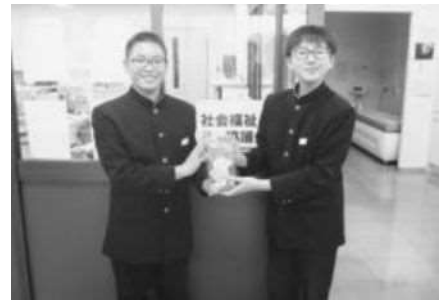
小平中学校 街頭・校内募金