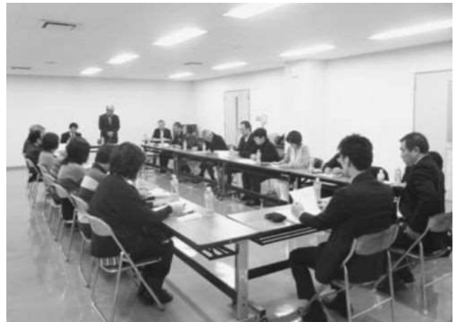
歳末たすけあい募金助成審査委員会