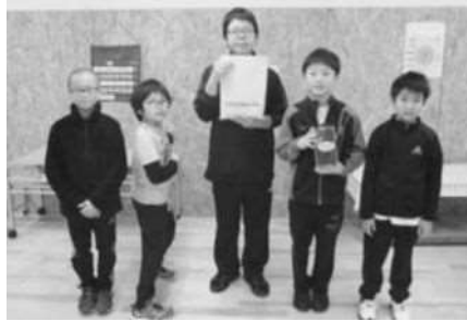
鬼鹿小学校 校内募金