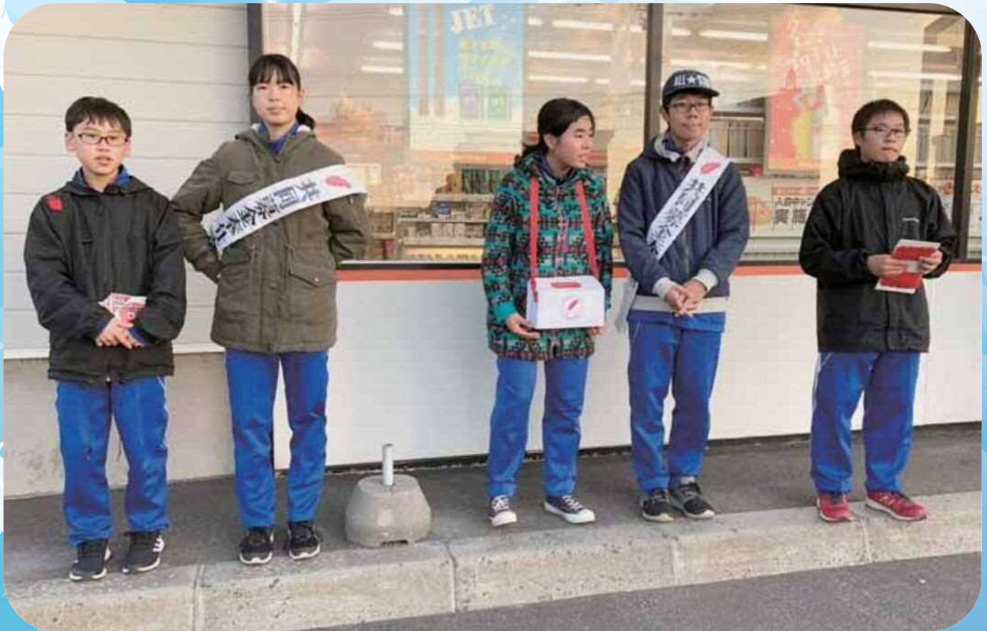
小平中学校 共同募金運動 街頭募金