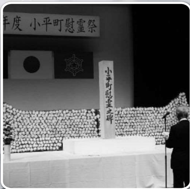
小平町慰霊祭(8月19日) 遺族会出席