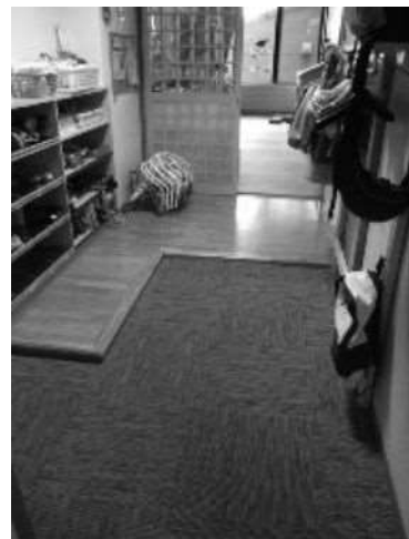
室内の床をたたみマットに替え、玄関もフローアマットに張り替えました