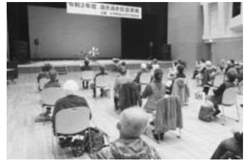
老人クラブ連合会(活き活き交流事業)