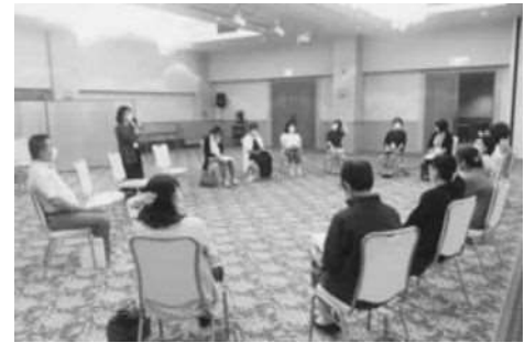
留萌管内主任児童委員研修会