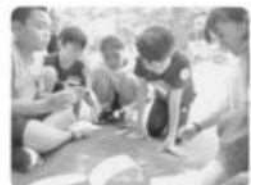
協力してパズルに挑戦する子どもたち

「健康・安全」「奉仕」「国際理解・親善」の実践を通じて、子どもたちの「いのちを大切にし、相手を思いやる」こころと「気づき、考え、実行する」力を育てています。