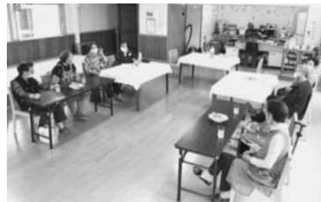
小平町結いの会（高齢者食事提供）

納入実績 35町内会 1,081世帯 会費 1,075,400円 会員の皆様から寄せられました会費は、布団丸洗い・除雪サービスなど小平町の地域福祉のために大切に使用して頂いております。