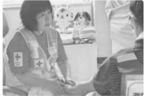
こころのケアを行う（北海道胆振東部地震）

北海道支部では、災害時に迅速に対応するために、日頃から災害救護訓練、救援物資の備蓄、救護資機材の整備などを行っています。