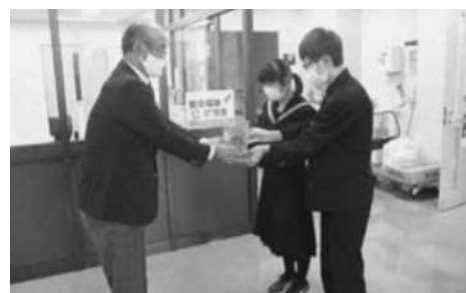
赤い羽根共同募金（小平中学校）