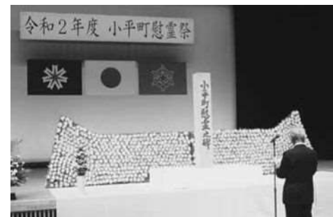
遺族会(小平町慰霊祭)