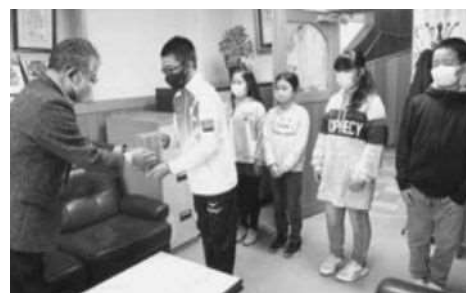
赤い羽根共同募金（小平小学校）