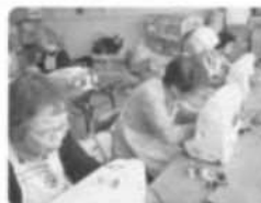
病院で使用するマスクを制作するボランティア

赤十字の使命である「困っている・苦しんでいる人の役に立ちたい」という思いを持つ方々により、地域のニーズに応じたボランティア活動を全国各地で行っています。