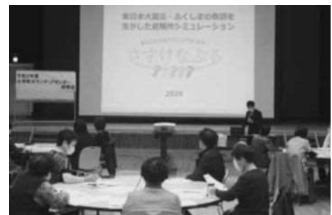
ボランティアセンター研修会