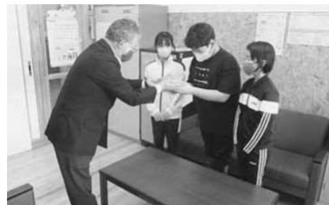
赤い羽根共同募金（鬼鹿小学校）