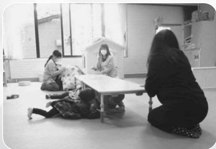
小平幼児センター（地震避難訓練）