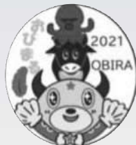
おびまる募金バッチ