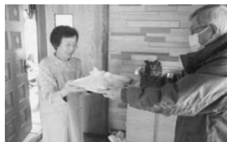
おせち料理配食事業