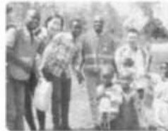
アフリカ・ルワンダ共和国での支援事業

190を超える国と地域に広がる赤十字のネットワークを活かし、紛争や自然災害、病気等で苦しむ世界中の人々を救うための救護活動を行っています。