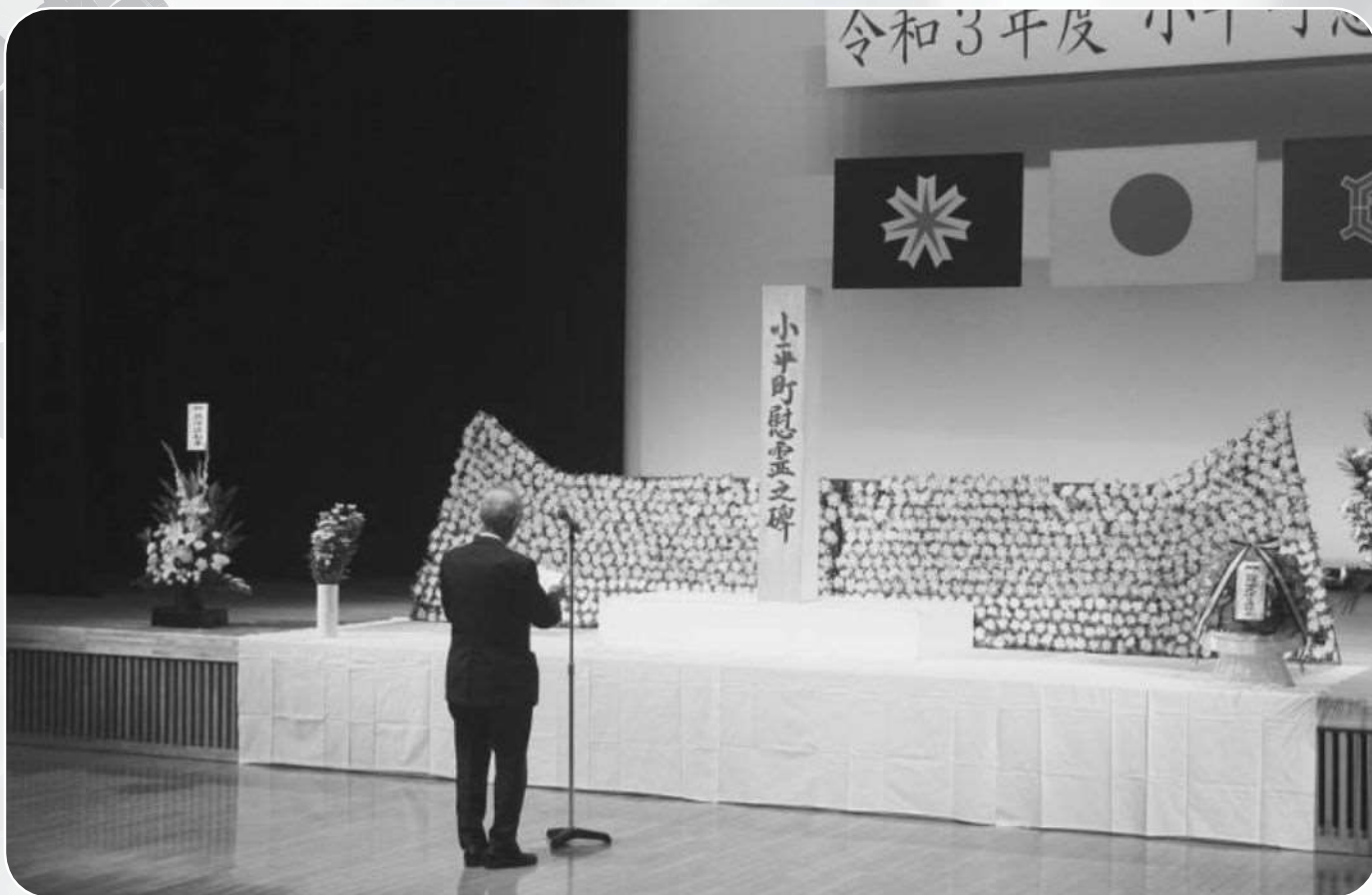
小平町慰霊祭（8月19日） 小平町遺族会参加