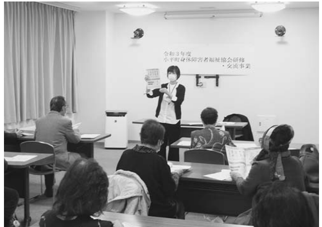
町身体障害者福祉協会研修・交流会