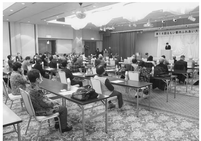
第14回もい管内ふれあい大会