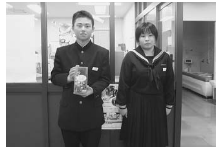
小平中学校 街頭・校内募金