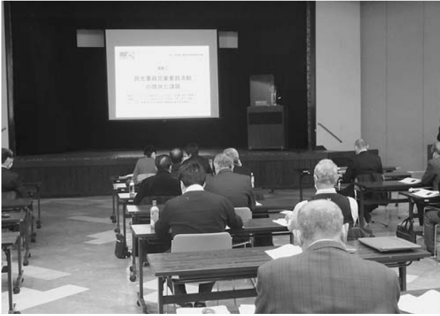
留萌管内民生委員児童委員専門研修