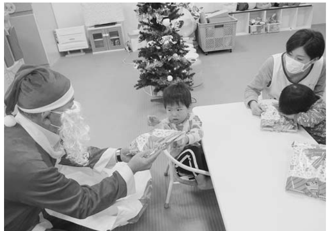
小平幼児センター「くるんぱ」 クリスマス会