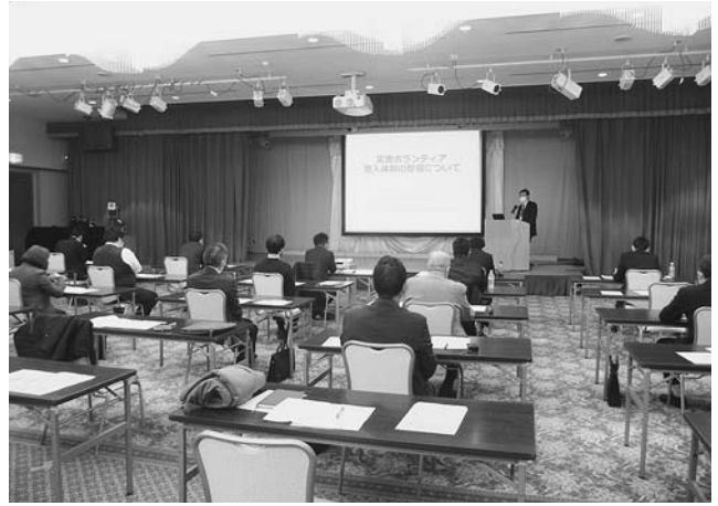
災害ボランティア組織連携会議