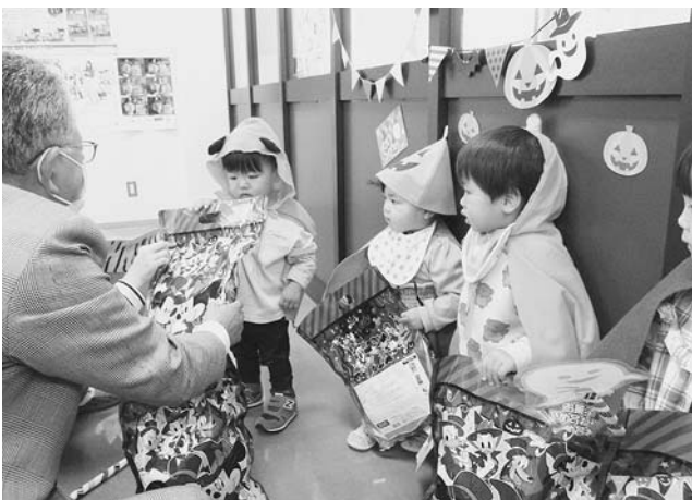
小平幼児センター「くるんぱ」 ハロウィン