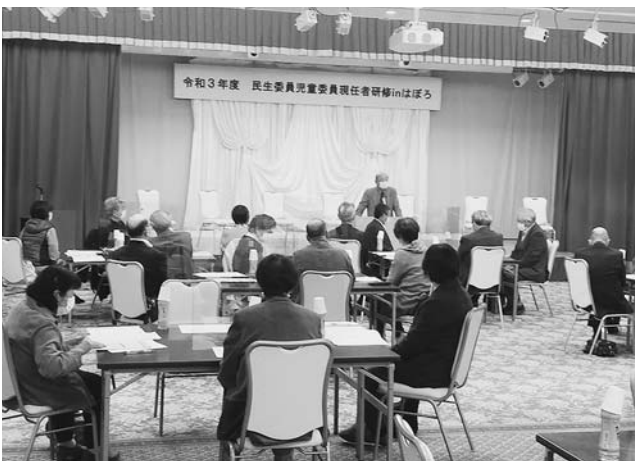
民生委員児童委員現任者研修 inはぼろ