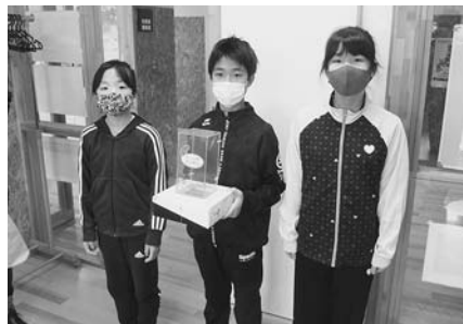
鬼鹿小学校 校内募金