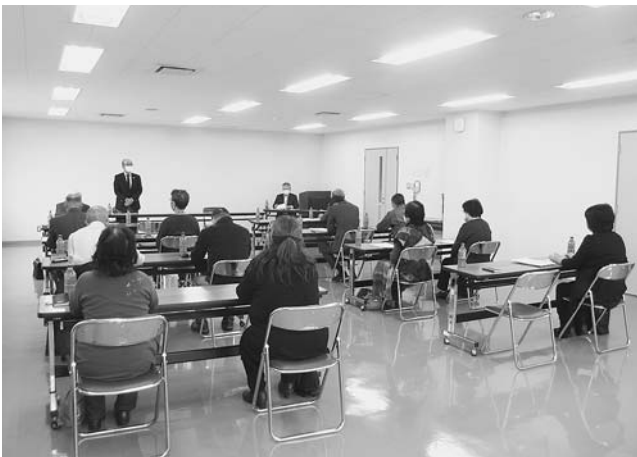
町共同募金委員会 第2回評議員会