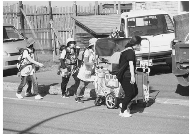
小平幼児センター「くるんぱ」 避難訓練 (津波)