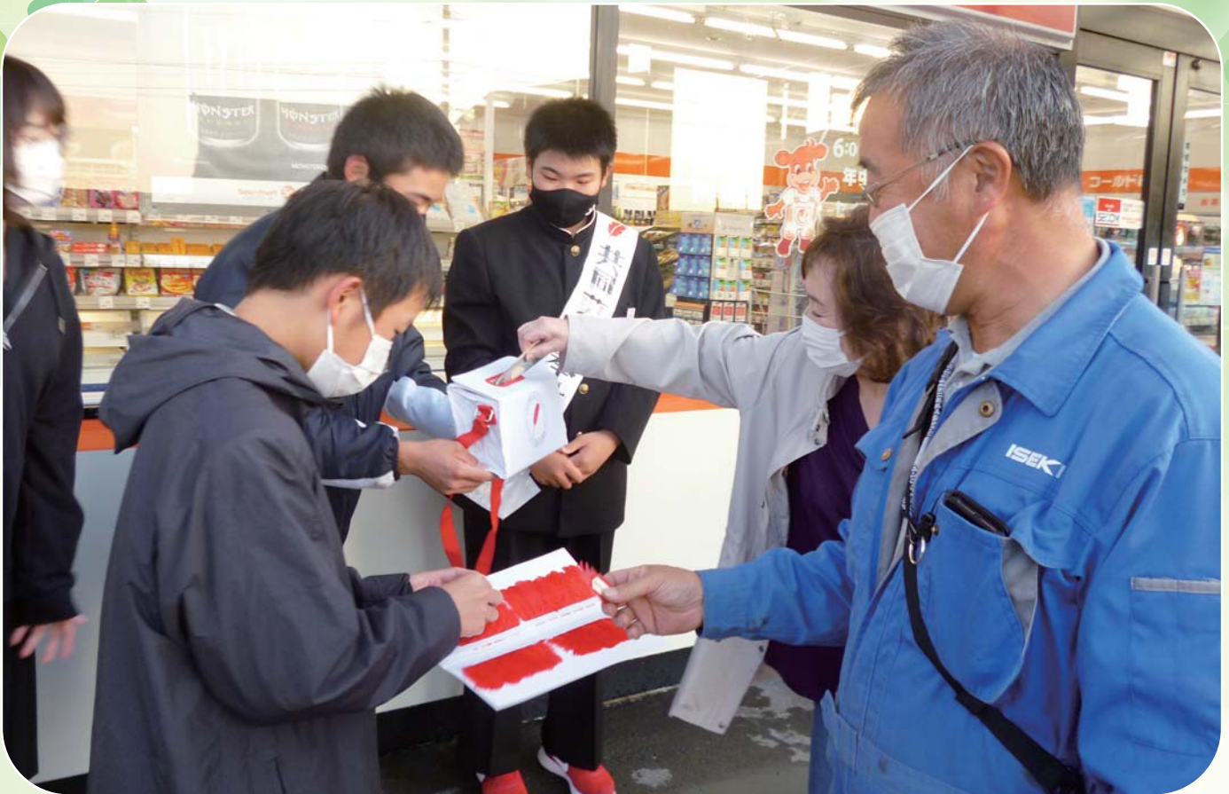
小平中学校 赤い羽根共同募金活動 街頭募金