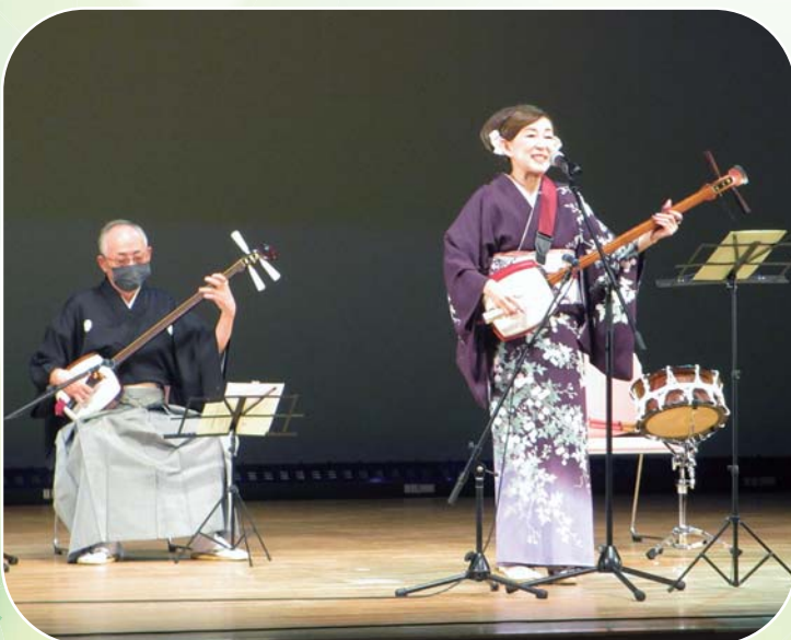
小平町老人クラブ連合会主催 「生き生き交流事業」