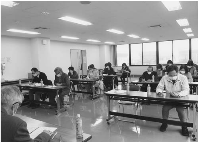
歳末たすけあい募金助成審査委員会