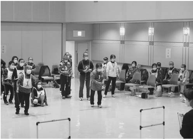
留萌地区ニュースポーツ交流会