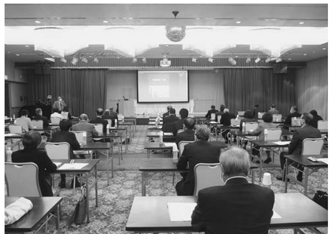
留萌管内社協づくり研修