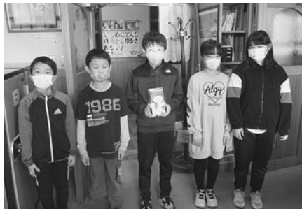
小平小学校 校内募金