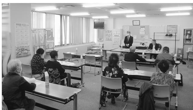
身体障害者福祉協会総会