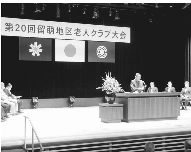
留萌地区老人クラブ大会(羽幌町)