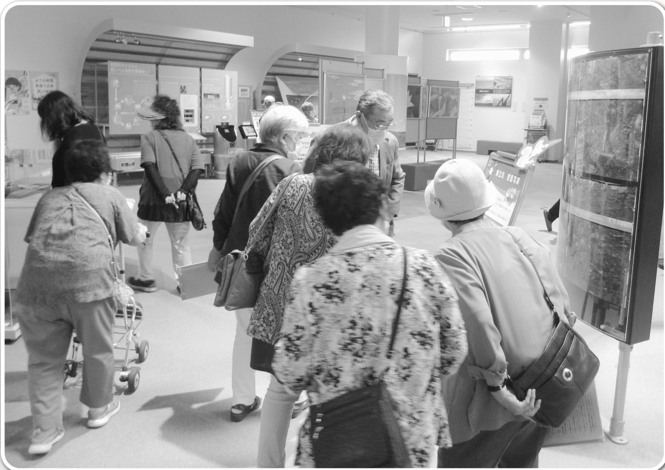
身体障害者福祉協会視察研修（幌延町 ゆめ地創館）