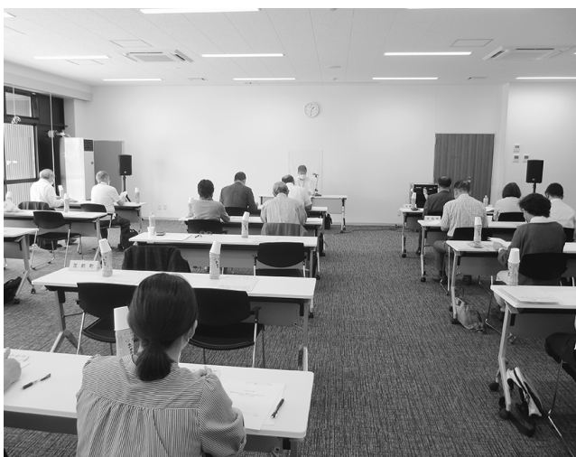
地域に理解され支持される社協づくり研修(苫前町)