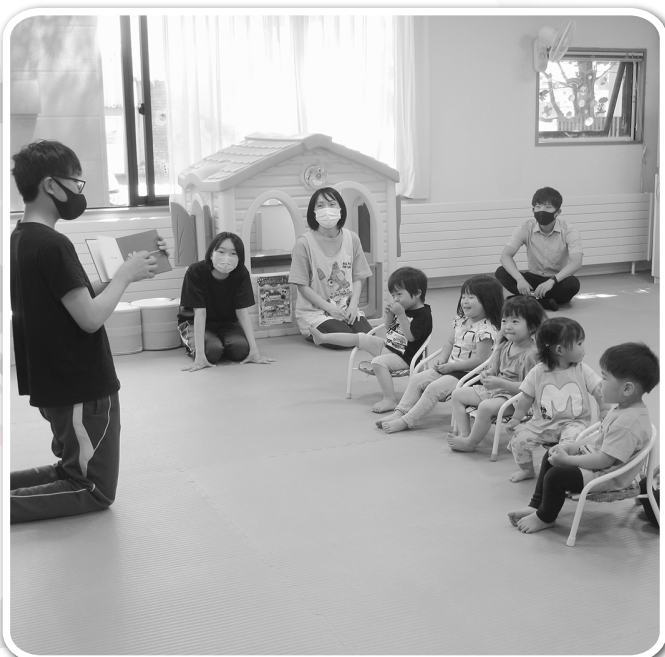
小平中学校2年生職場体験学習 （小平幼児センター）