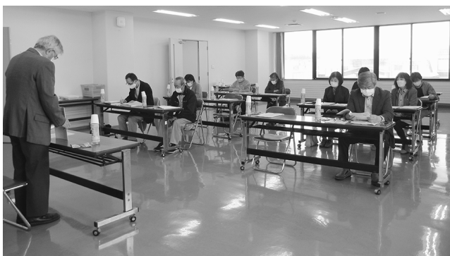
民生委員協議会総会