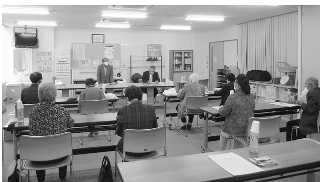
老人クラブ連合会総会