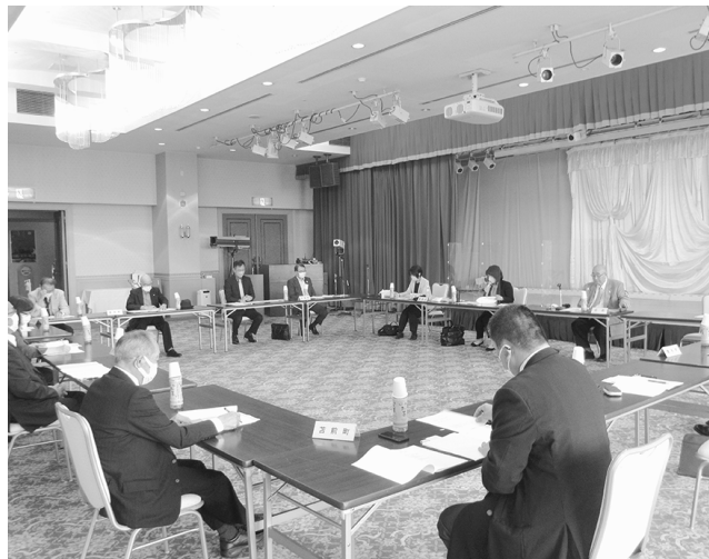
留萌地方共同募金委員会理事会(苫前町)