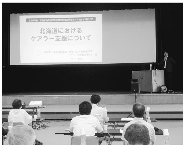
管内町村民生委員児童委員研修(増毛町)