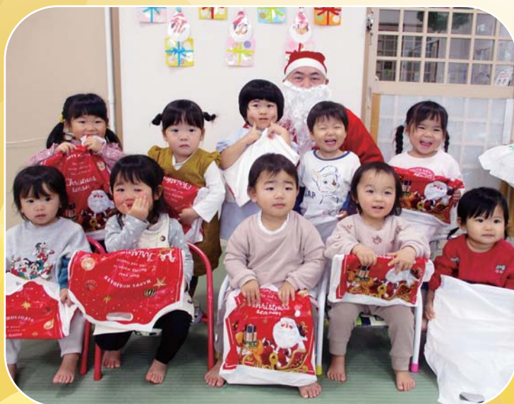
小平幼児センター「クリスマス会」