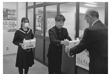
小平中学校 街頭・校内募金