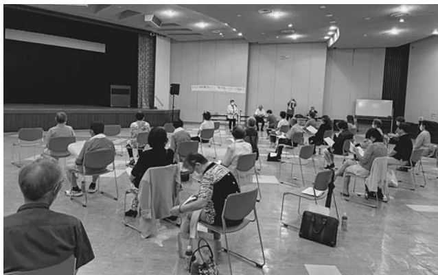
留萌南部圏老連小ブロック研修会（9/12・留萌市） 悪天候で国道が通行止めとなったため、苫前町を除く35名が参加しました。研修では椅子を使ったヨガを体験しました。次年度は小平町です。