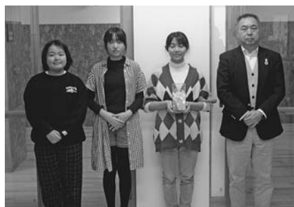
鬼鹿小学校 校内募金