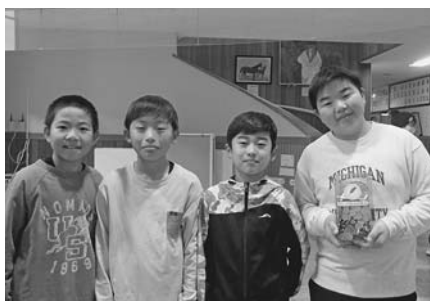
小平小学校 校内募金