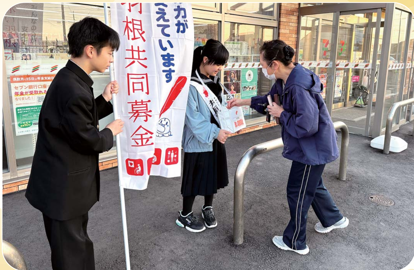
小平中学校 赤い羽根街頭募金