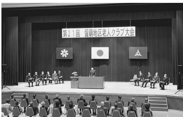
留萌地区老人クラブ大会（10/12・初山別村） 約200人の参加で開催された本大会には、町老連から20名が参加しました。表彰式では、町の4名を含む21名が表彰され、アトラクションとして有明神社例大祭の奉納神楽についてビデオ鑑賞しました。