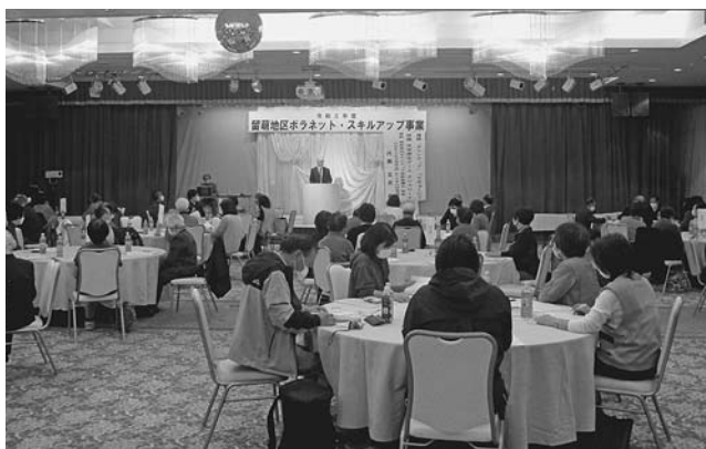
ボラネット・スキルアップ事業（10/28・羽幌町） 町ボランティアセンターから5名、約100名が参加し、ボランティアに関する講義の後、災害想定ゲームで十人十色の考え方があることを認識しました。