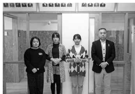
赤い羽根共同募金(鬼鹿小学校)