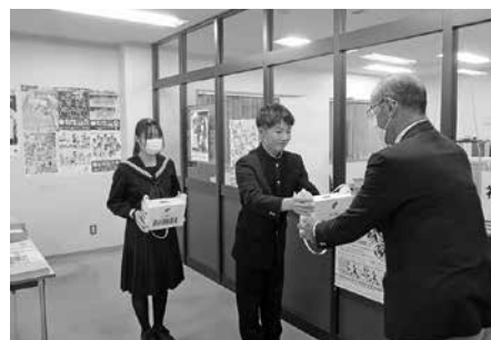
赤い羽根共同募金(小平中学校)