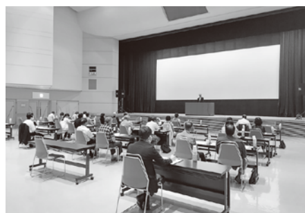
管内町村民生員児童委員研修会