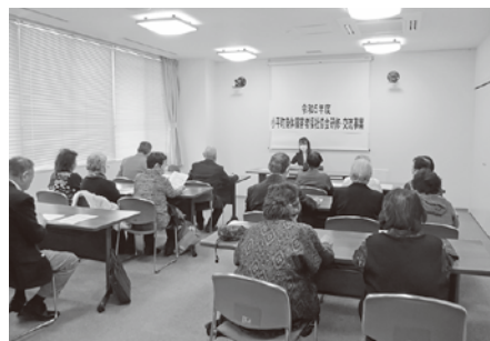
身障者福祉協会研修交流事業