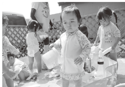
幼児センター水遊び