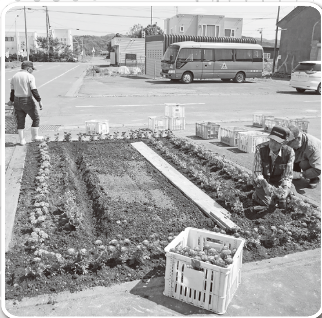
環境整備事業 (本郷亀鶴会)