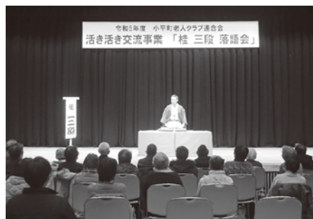
活き活き交流事業(老連)