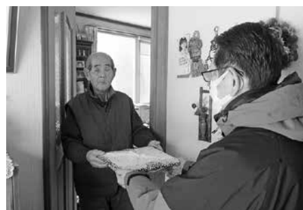
おせち料理配食事業