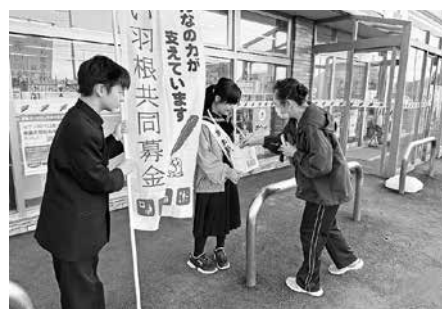
小平中学校街頭募金