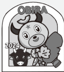
おびまる募金バッチ