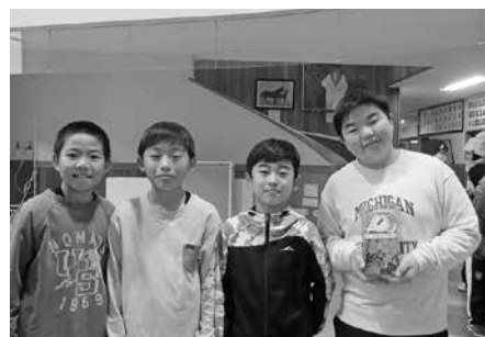
赤い羽根共同募金(小平小学校)