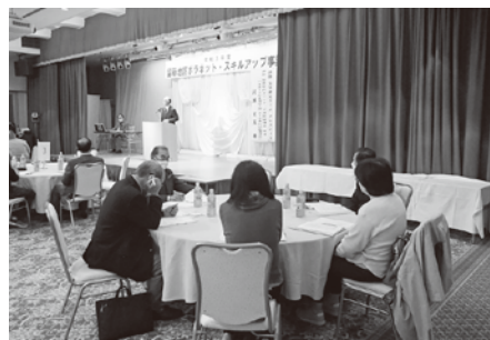
ボラネット・スキルアップ事業