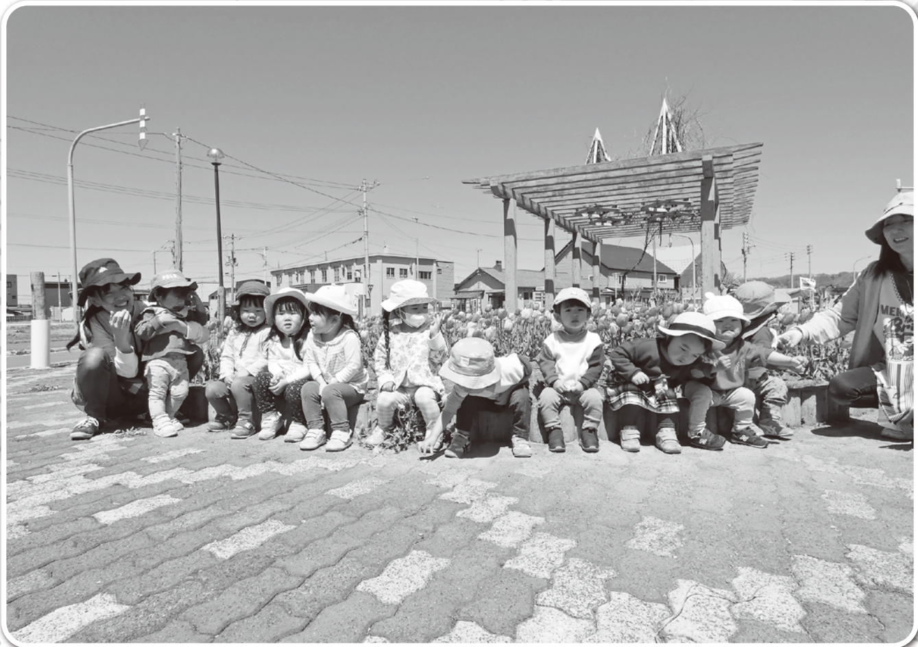
小平幼児センター おさんぽ