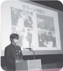
ボランティア発表会