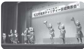
はちまる歌劇団 様