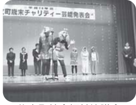
礼文町社会福祉協議会 職員会