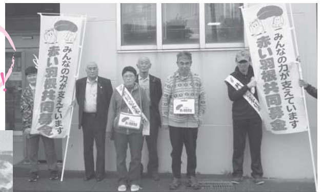
「礼文町うすゆきの会」による街頭募金