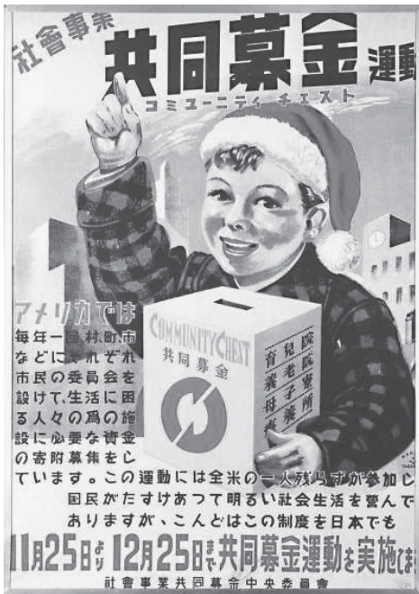
1947（昭和22）年、 第1回共同募金運動のポスター