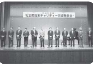
礼文町校長会・教頭会 様