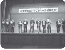
礼文町社会福祉協議会 役員一同