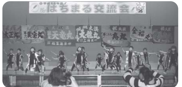
礼文観光開発(株)様より、はちまる交流会 開催あたり、寄付をいただきました。