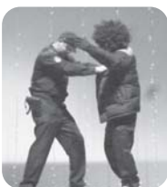
護身術 香深駐在所・船泊駐在所 様