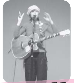
音更町出身の歌手 流さんのミニライブ