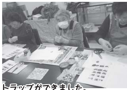
細かい作業でしたが、素敵なおアクセサリーやストラップができました。