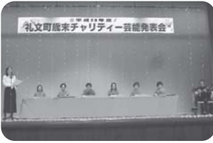
大正琴あじさいの会 様