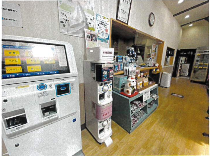
※ 道の駅 しょさんべつ レストハウス「ともしび」内