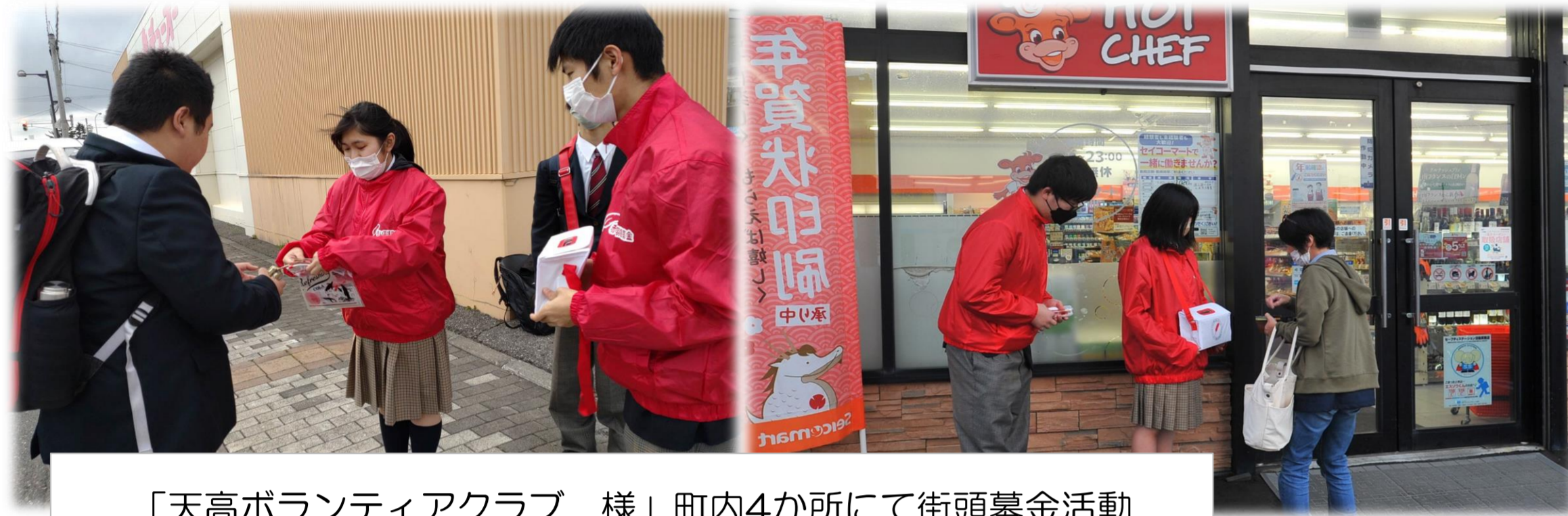
「天高ボランティアクラブ 様」町内4か所にて街頭募金活動