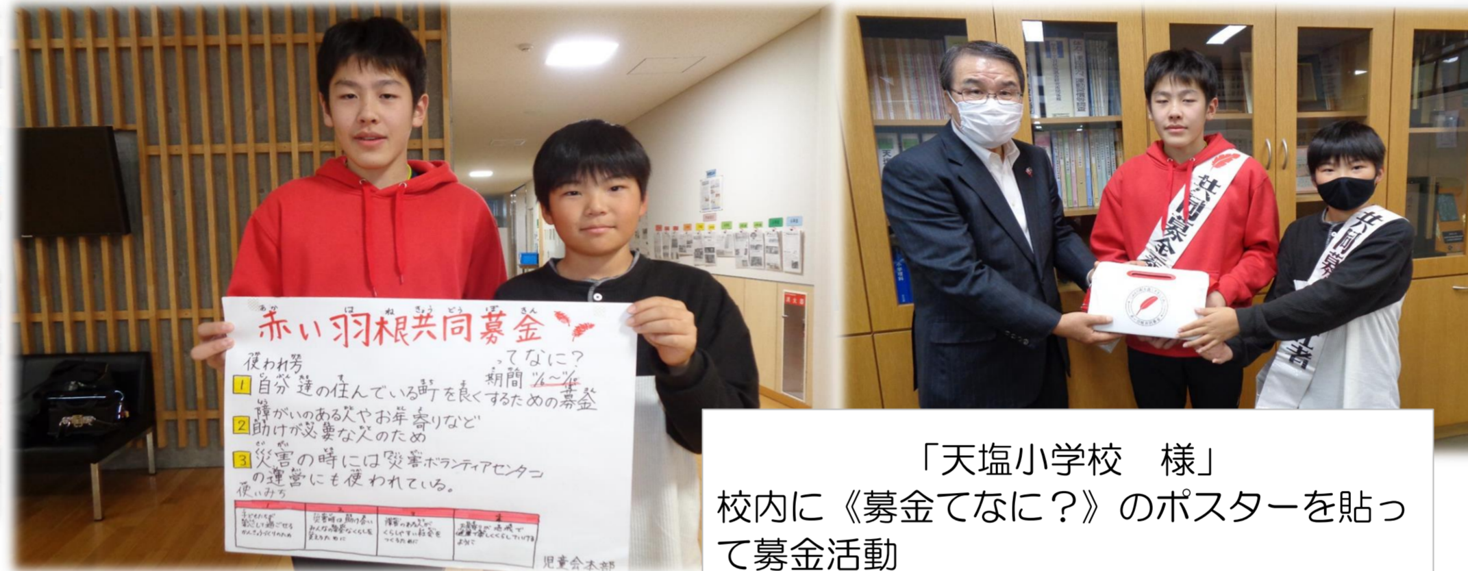
「天塩小学校 様」 校内に《募金てなに?》のポスターを貼って募金活動