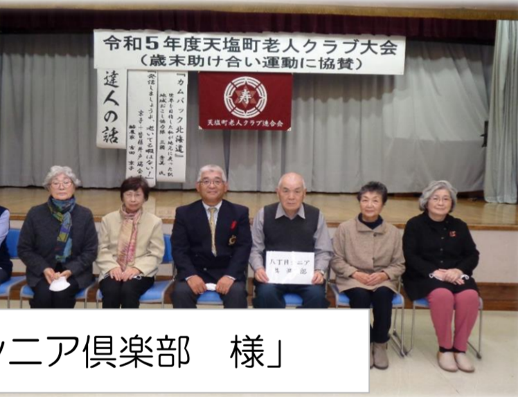
「八丁目シニア倶楽部 様」