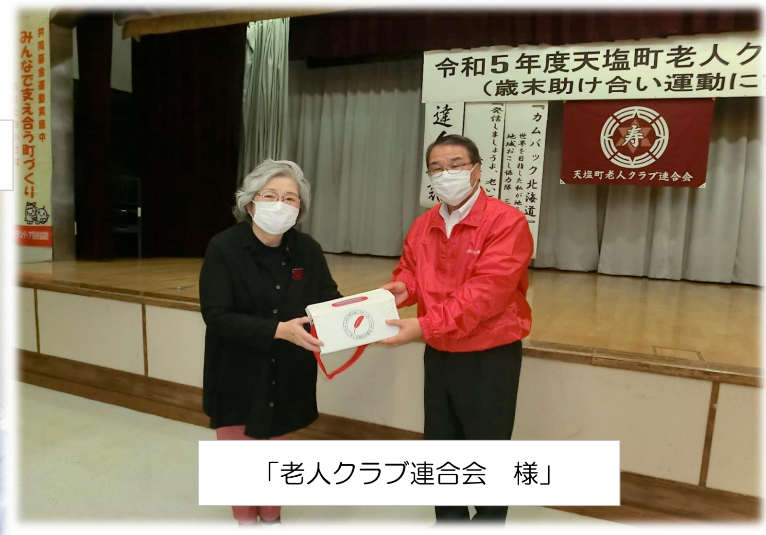
「老人クラブ連合会 様」