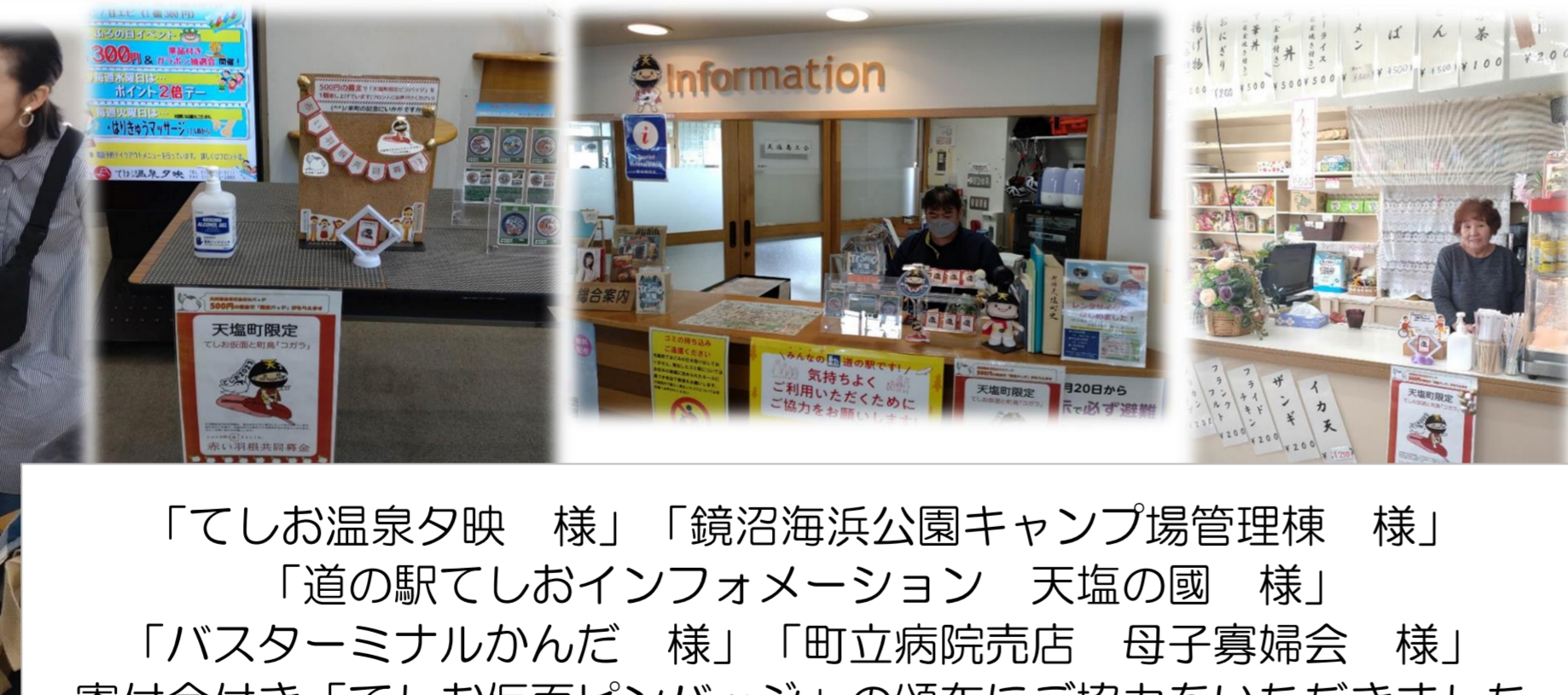
「てしお温泉夕映 様」「鏡沼海浜公園キャンプ場管理棟 様」 「道の駅てしおインフォメーション 天塩の国 様」 「バスターミナルかんだ 様」「町立病院売店 母子寡婦会 様」 寄付金付き「てしお仮面ピンバッジ」の頒布にご協力をいただきました