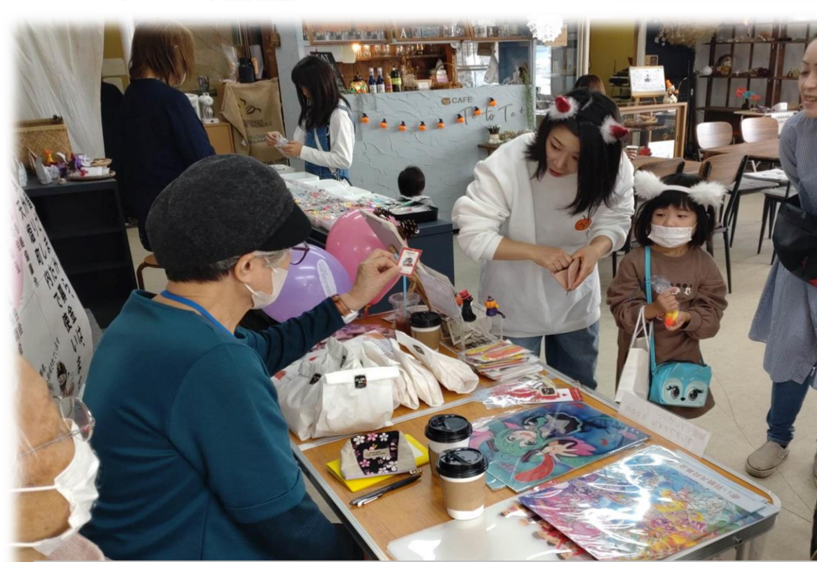
「母子寡婦会 様」 コミュニティカフェTetote+にて募金活動