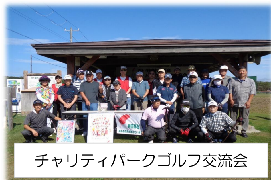
チャリティパークゴルフ交流会