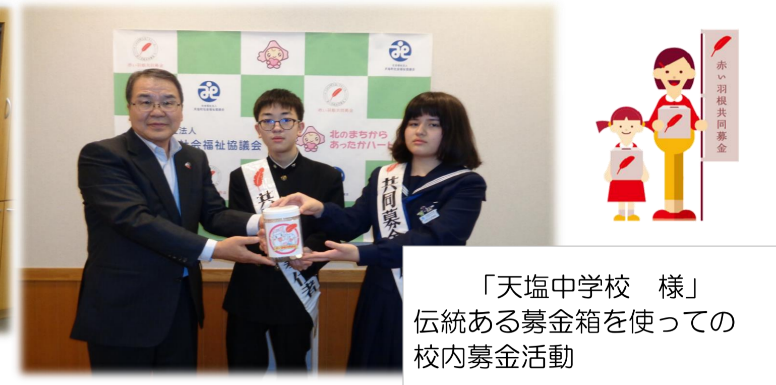
「天塩中学校 様」 伝統ある募金箱を使っ ての校内募金活動