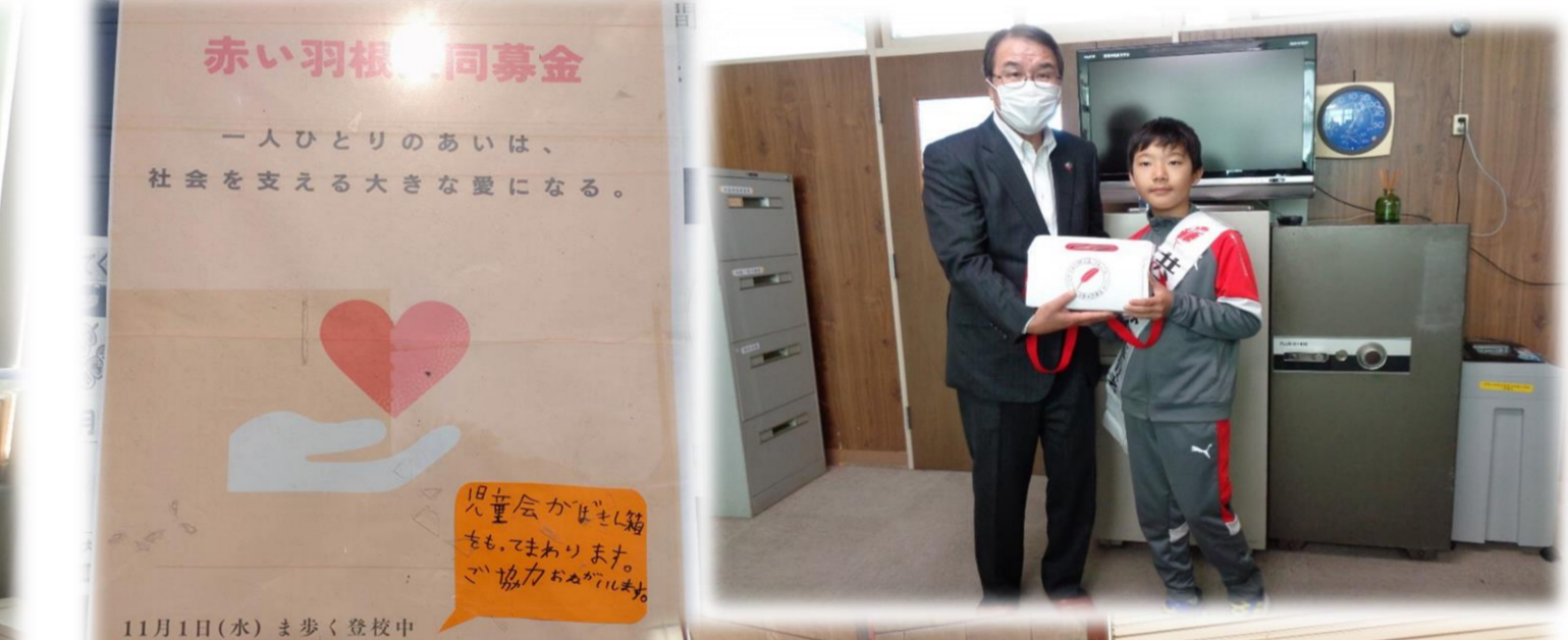
「啓徳小学校 様」 《ま歩く登校》時の募金活動についてポスターを貼って事前に活動を周知