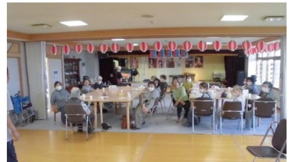
〈介護予防支援事業〉