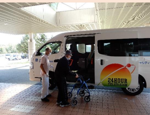
〈外出支援サービス事業〉

町から指定管理を受けております3施設の運営も、21年度からの実績・ノウハウをふまえ、職員の研修会参加や勉強会を積極的に開催し、看取り介護を開始する等、介護の質の向上を行うとともに着実に安定した経営に努めました。