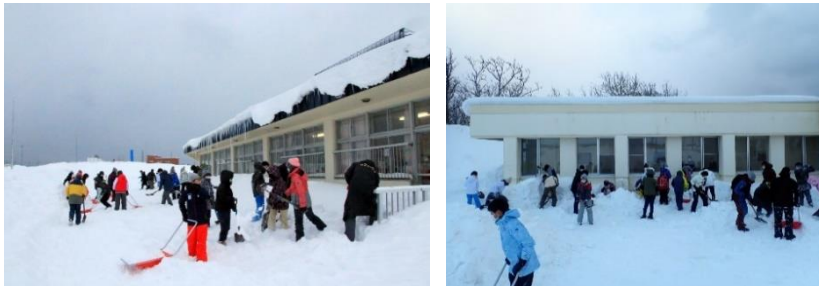
〈天塩中学校様 除雪ボランティア〉