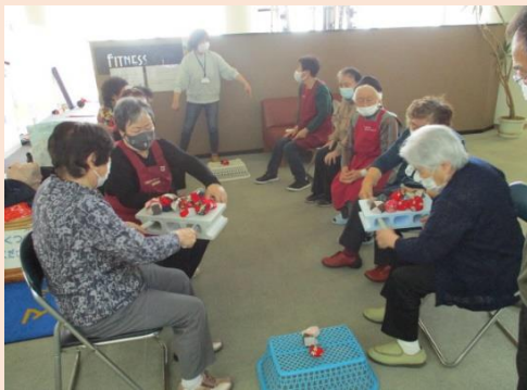
<地域介護予防活動支援事業(サロン)>

今後も、福祉ニーズの多様化・複雑化に対応するため、効率的・効果的な経営を実践し、社会福祉の向上に努めてまいります。(決算報告は社協ホームページにも掲載しております)