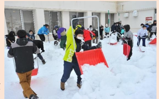
<天塩中学校除雪ボランティア>

町から指定管理を受けております3施設の運営も、21年度からの実績・ノウハウをふまえ、職員の研修会参加や勉強会を積極的に開催し、看取り介護を開始する等、介護の質の向上を行うとともに着実に安定した経営に努めました。