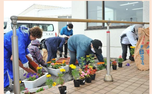
〈天塩町母子寡婦会 花植えボランティア〉

町から指定管理を受けております3施設の運営も、21年度からの実績・ノウハウをふまえ、職員の研修会参加や勉強会を積極的に開催し、介護の質の向上を行うとともに着実に安定した経営に努めました。