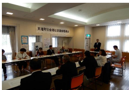
(天塩町社協 理事会)