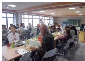
(老人福祉センター 集会室)