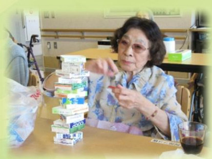
牛乳パック積みゲーム