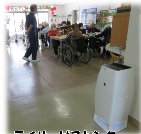
デイサービスセンター