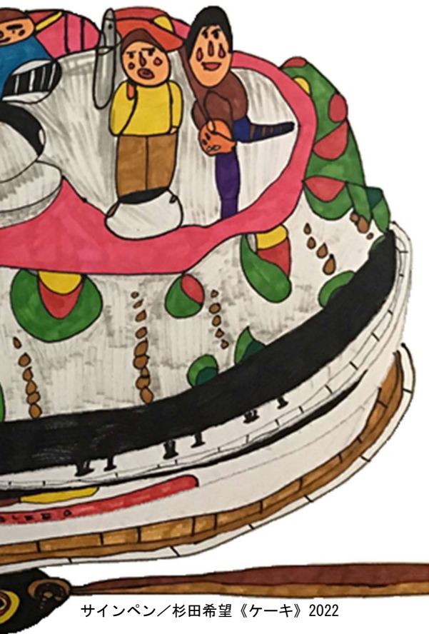
サインペン／杉田希望《ケーキ》2022